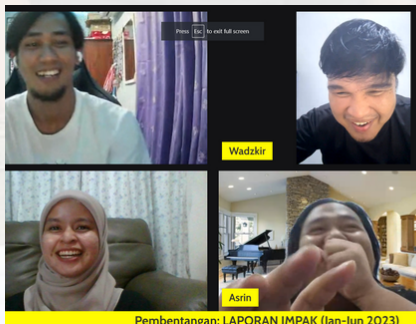
Pembentangan: LAPORAN IMPAK (Jan-Jun 2023)

LFA tahun ini adalah siri kedua dan kali ini dengan kerjasama penuh Yosh Sandakan. Pertandingan futsal membabitkan Pusat Alternatif dan Sekolah Swasta di Sandakan ini adalah bertujuan untuk pembangunan sukan dalam kalangan anak-anak rentan.