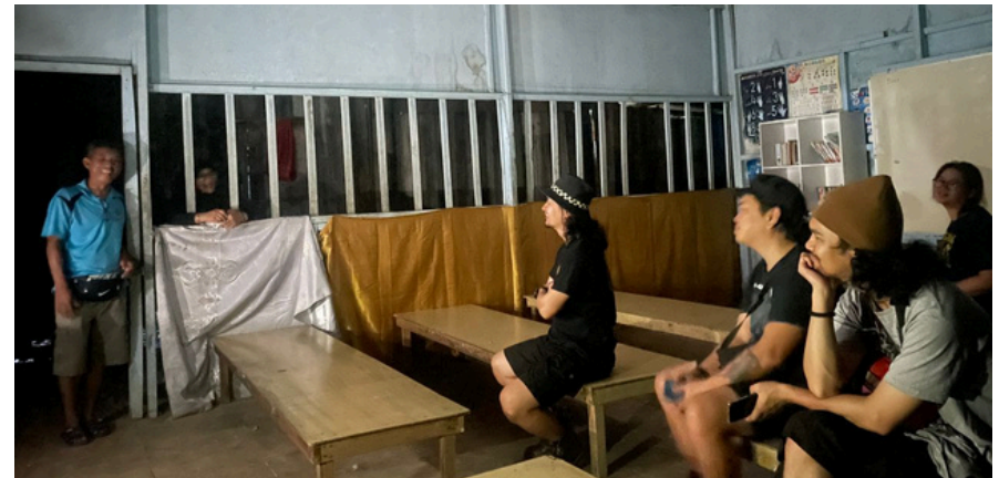
Diskusi malam bersama Pangrok Sulap